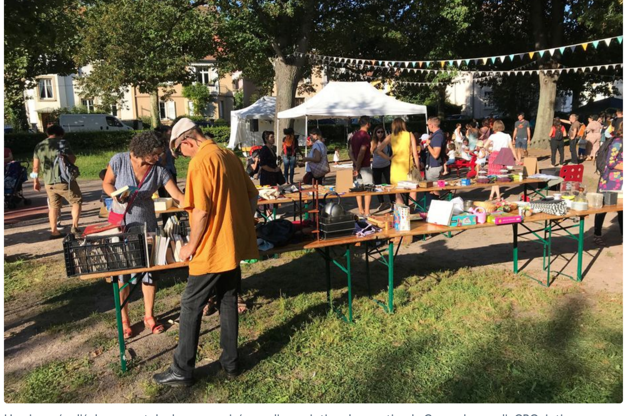
Une journée d'échanges et de dons organisée par l'association de quartier de Cronenbourg, l'aCROciation, en septembre 2021